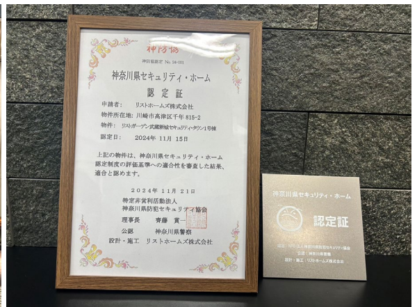
画像左：11月21日開催 神奈川県セキュリティ・ホーム認定 認定式の様子 画像右：認定証