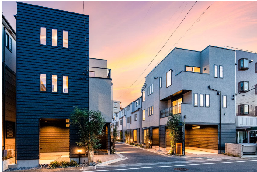
画像：意匠性と防犯を兼ね備えた外構とバルコニーの透明ガラスの手すり

外構部は4m先の人の顔の向きや挙動姿勢などが認識できる程度の明るさである3ルクスを保つことが可能。バルコニーの手すりは透明ガラスを採用しているため、侵入者が近づきがたく、かつベランダからの侵入がしづらい構造になっています。また、一部の雨樋には忍び返しも付いています。